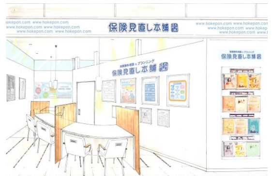
店舗完成イメージ

保険見直し本舗は生損保51社の商品の中から、消費者にとって最適なプランを提案する保険代理店です。ファイナンシャルプランナーを中心とした保険相談スタッフが、賢い保険の加入方法を無料でアドバイスいたします。対面販売・テレマーケティング(店舗数：全国156拠点)を中心に活動を展開しており、月間新規申込件数は約10,000件となっております。(2012年6月末時点)