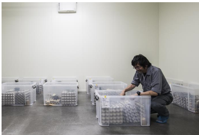
中外化成 飼育研究室内