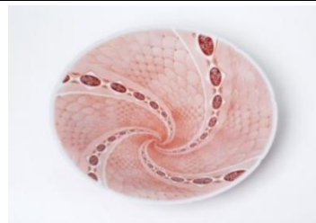
〈代表作品〉 赤絵網手台皿