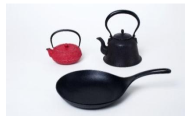
〈代表作品〉 急須 格子アアレ (左)、平底撫肩鉄瓶 1L (右)、 オムレット 24cm (下)