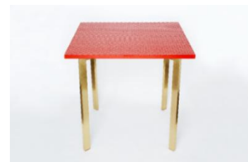
〈代表作品〉 テーブル／ubushina