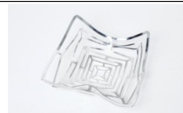
〈代表作品〉 KAGO スクエア L