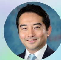
五十嵐立青 (つくば市長)