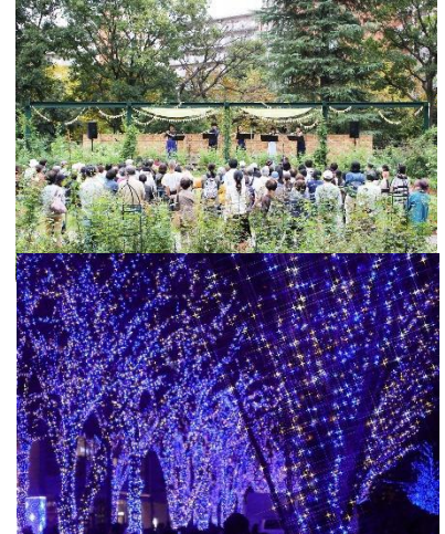
ガーデンコンサートイメージ（上） イルミネーションイメージ（下）