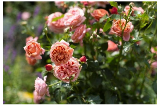
チーフガーデナー忽滑谷氏作出の‘パウル・クレー’