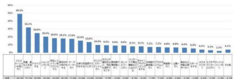
回答形式：クリスマスは「おでかけする/おでかけしたい/おでかけもしたい」と回答した人 n=221/MA