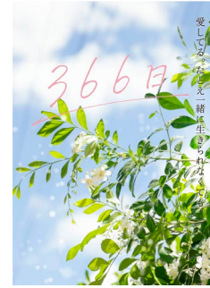
専用タグイメージ