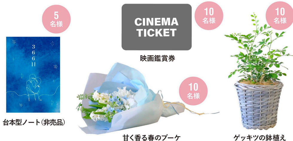
台本型ノート(非売品)