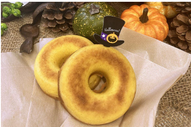
米粉で作ったカボチャの焼きドーナツ 1個 250円（税込）