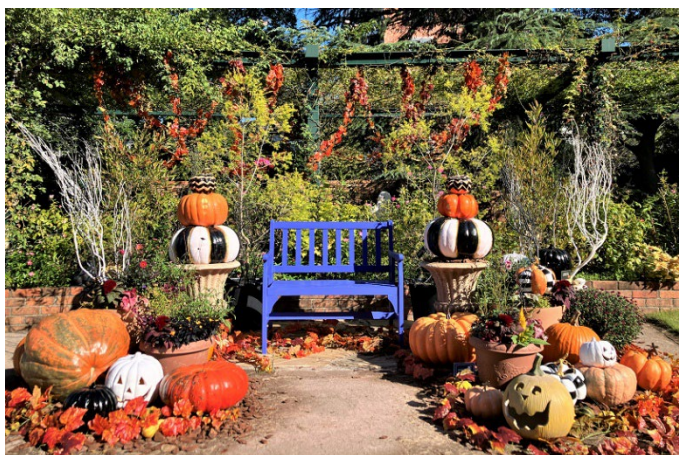
香りのローズガーデンフォトスポット