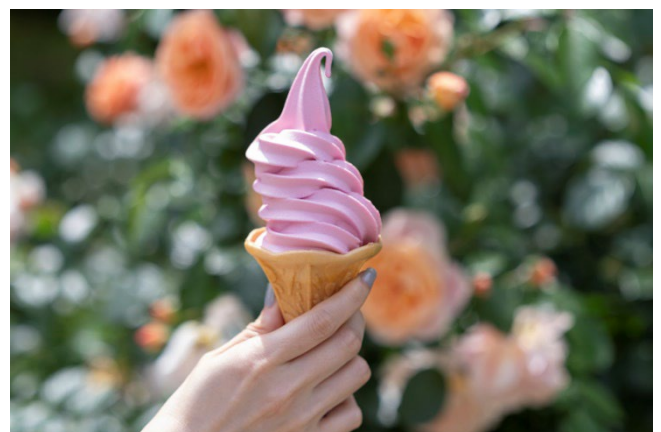
ローズソフト 400円（税込）