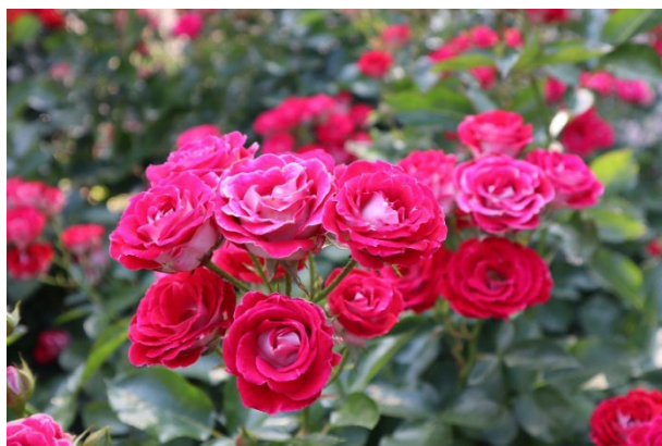
この秋おすすめの“岳の夢”

昨年、ハロウィンイベントとして開催したパレードの大盛況をうけて、今年はハロウィンならではのスタンプラリーイベントを開催いたします。ハロウィン気分を楽しみたい方はイベント日に、ゆったり落ち着いて秋バラを楽しみたい方はあえてイベント日を外した日にご来場いただくのもお勧めです。