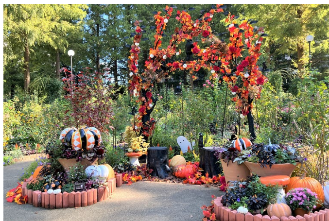
色彩のローズガーデンフォトスポット