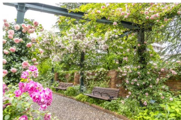
香りのローズガーデン