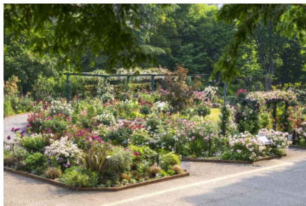
香りのローズガーデン

ダマスク、スパイシー、ミルラ、フルーティー、ブルー、ティーの6種類の香りごとにバラを配置した「香りのローズガーデン」では、世界のコンクールで香りに関する賞を多数受賞しているバラや、香りが非常に強く世界で人気のバラなど香り豊かな品種を取り揃えています。ご自身のお好みの香りを探したり、香りの違いを感じながら優雅なバラの香りに包まれたガーデンをお楽しみください。