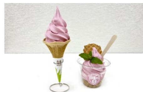
ローズソフト 400円（税込）／ガーデンパフェ 550円（税込）

https://www.shikinokaori-rose-garden.com/news/6007/