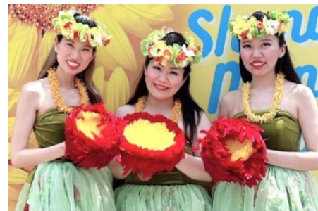
WAINANI HULA STUDIO