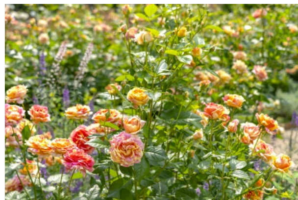
シンボルローズ「四季の香」

朝のお散歩やお出かけ前に立ち寄って、フレッシュな春バラの香りに癒され、素敵な一日のはじまりをお迎えください。