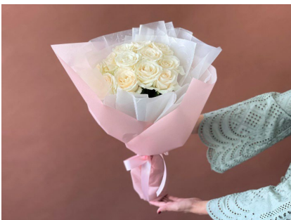
12本のバラに素敵な意味を込めた ダズンローズもおすすめです