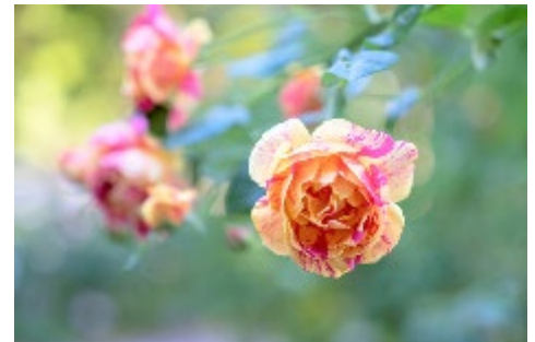
シンボルローズ「四季の香」

『練馬区立 四季の香ローズガーデン』では、フルーティーな香りやスパイシーな香りなど 6 種類の香りの違いごとに作庭した「香りのローズガーデン」と、パレットのようにバラを花色ごとに配置した「色彩のローズガーデン」で秋バラをお楽しみいただけます。そして、爽やかな紅茶を感じるティーの香りと、園のある光が丘をイメージした黄色とピンクのマーブル模様が木洩れ日の暖かい光を表現する、当園オリジナルのシンボルローズ「四季の香」も見頃を迎えます。