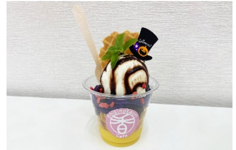
ハロウィンパフェ／550円（税込）