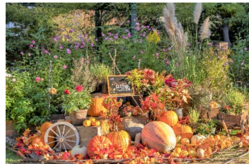
2022年のハロウィンフォトスポット