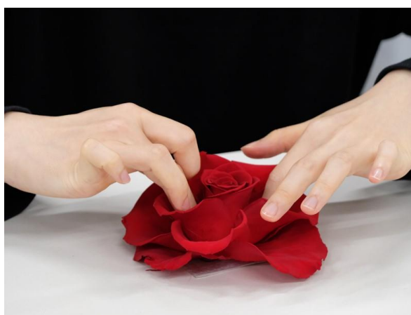
花びらを一枚一枚調整して規程の大きさに整えます