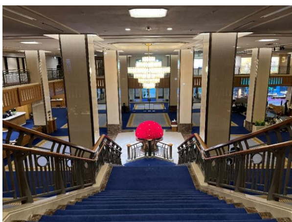
ロビーのどの方向から見てもドーム型に

完成までの工程ひとつひとつに第一園芸フローリストの丁寧な技術やこだわりを重ねることで、歴史ある帝国ホテルのロビーを彩り、お客様に感動が伝わるロビー装花が作られています。