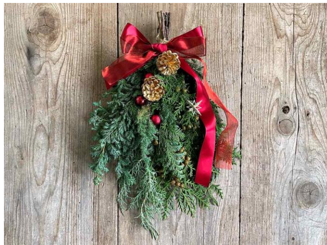
スワッグ おうちで制作キット/5,500円(税込)