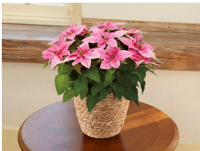
プリンセチア ピンクホワイト/5,500円(税込)

オンラインショップではこの他にも、クリスマスやお歳暮、誕生日や記念日の贈り物からご自宅用まで、様々なシーンにご利用可能な、第一園芸が自信を持ってお勧めする商品を豊富にご用意してお待ちしております。