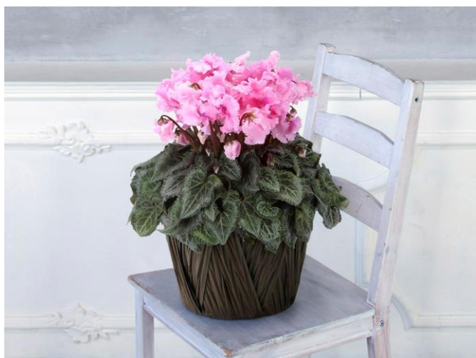
シクラメン ファルバラローズ 5号/5,500円(税込)

クリスマスに向けて街中を華やかに彩るポインセチアもおすすめです。中でもプリンセチアはその華やかな印象から「プリンセス」にちなみ名づけられた、ポインセチアの仲間です。いろいろなカラーバリエーションをご用意しています。