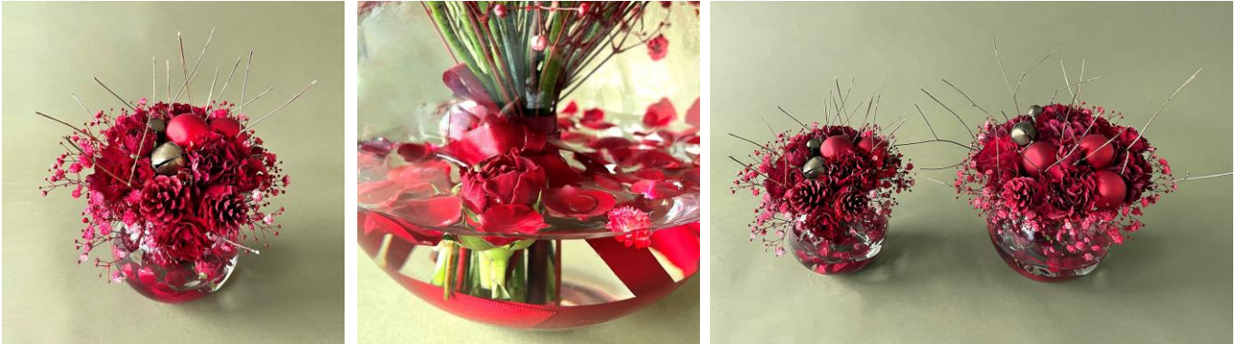
※商品はおひとつ。(左) プティ、(右) グラン

エルベ・シャトランの定番 Bijoux (ビジュウ) は、花と花器と水のハーモニー。