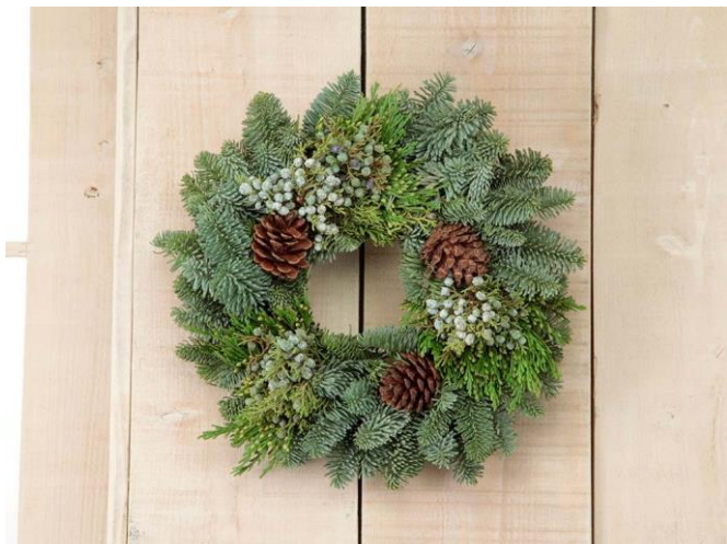
オレゴン産フレッシュミックスリースM/5,280円(税込)

アメリカ・オレゴン州の農園で栽培し、熟練の職人が手作りした毎年人気のモミのフレッシュリースや、自分で作って楽しむナチュラルスワッグなど、クリスマスギフトやホームユースにもぴったりのアイテムもオンライン限定販売します。