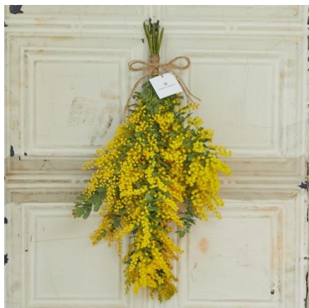
※画像はイメージです。使用する花や資材は店舗や入荷状況によって異なります。