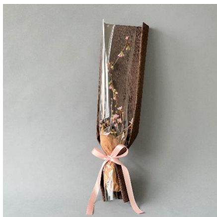
※画像はイメージです。使用する花や資材は店舗や入荷状況によって異なります。