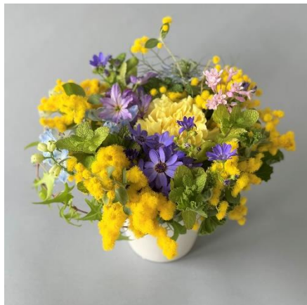
※画像はイメージです。使用する花や資材は店舗や入荷状況によって異なります。