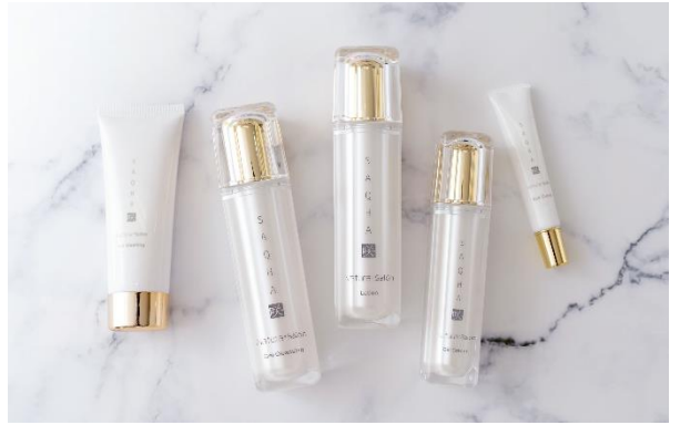
※咲白 SAQHA スキンケアシリーズ

美を追求してきたNaturaのサロン専売品が登場。女性が美しくなる為にお肌に使うものや身体にいれるものは、結果はもちろん安心・安全が何より大切だと考え、高品質な商品づくりをおこなっております。 沢山の女性が自信を持ち、キラキラと輝けるようエステティックサロンの枠を超えて創り上げたNatura製品です。