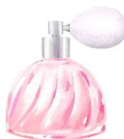
Minette Pêche Eau de Toilette

女の子の気分を上げるプシュプシュポンプと上品なドレープボトル。どこまでも女の子が「かわいい」と思うカタチを追求しました。