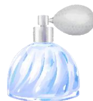
Chipie Pomme Eau de Toilette