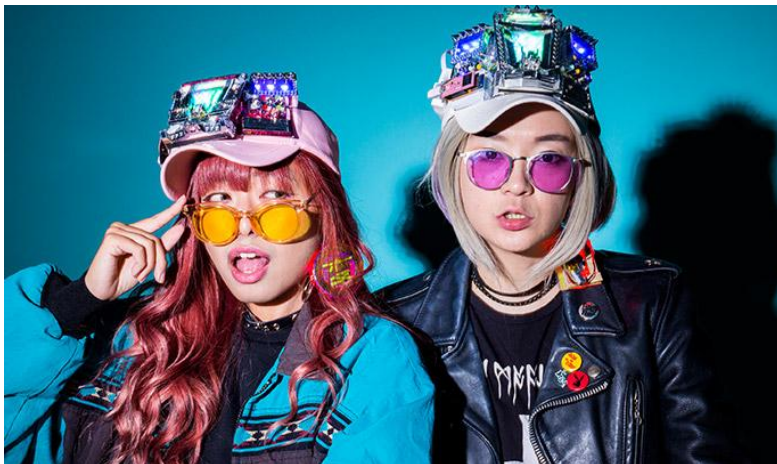
アイキャッチの強いリポーターをキャスティング