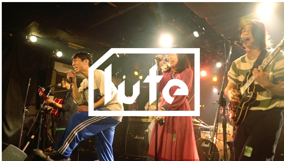
第1回TOKYO BIG UP!グランプリ:パレーボウイズ「卒業」