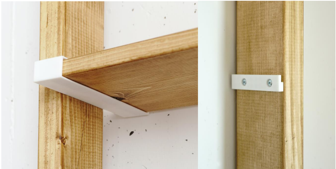
右:柱にアダプタをつけた状態