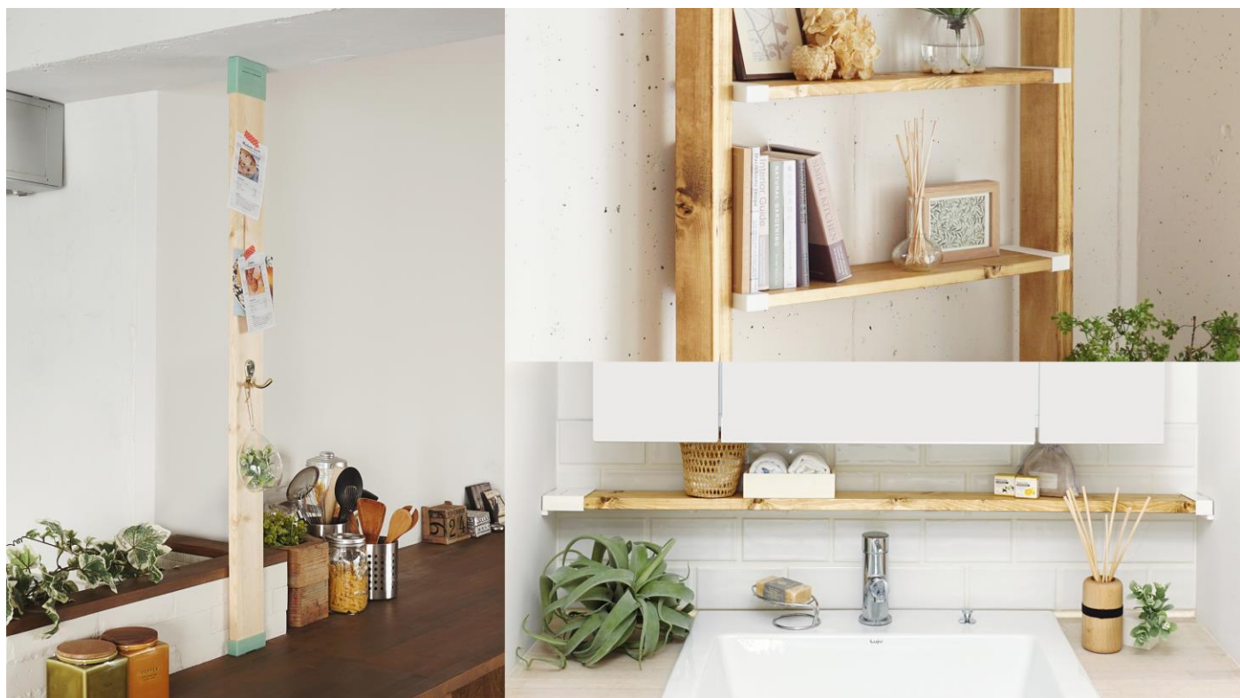
LABRICO(ラブリコ)新シリーズ 左:「1×4 アジャスター」、右上:1×6 棚受、右下:1×4 アジャスターサポート

突っ張り棒を主力とする家庭向け収納用品の開発メーカーである平安伸銅工業株式会社(本社:大阪市西区、代表取締役:竹内 香予子)は、女性や家族が楽しめる、安全で手軽なDIY パーツブランド「LABRICO(ラブリコ)」の新シリーズ“ワンバイ材に使用できるDIY パーツ”として『1×4 アジャスター』、『1×4・6・8 棚受』、『1×4 アジャスターサポート』を2017年9月中旬より一般発売いたします。2016年8月発売の2×4(ツーバイフォー)材用に続く新シリーズです。