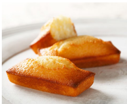
アンリ・シャルパンティエの代表商品 フィナンシェ