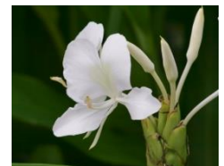
香りイメージ (ホワイトジンジャー)

マタタビ果実エキス、サンゴ草抽出液※6、チンピエエキス※7(保湿成分)配合で、甘く優しいホワイトジンジャーの香りの「フェイシャルスト ブランクレイマスクW」は、ミネラル豊富なホワイトクレイ配合の白いクレイパック。コクのあるなめらかなテクスチャーで肌に密着し、古い角質をケア。みずみずしい透明感あふれる肌印象へと導きます。