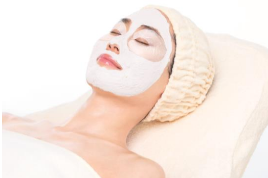
(写真左)パッケージ (右)パック施行イメージ