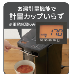
計量カップいらず「お湯計量機能」