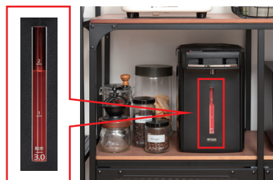
置き場所に困らない「蒸気レス構造」