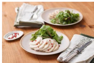
炊飯器でしっとりサラダチキン