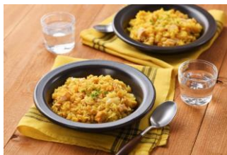
包丁要らず♪炊飯器で チーズカレーピラフ