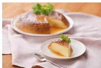
炊飯器で夢のスイーツ！ ビックリプリン