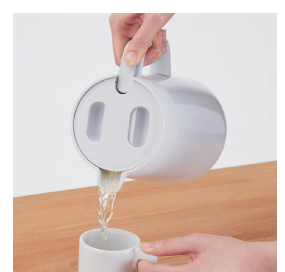
プッシュレバーで注ぎやすい