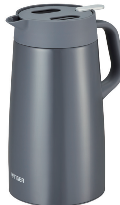
ダークグレー<HD> (PWO-A160・A200のみ)