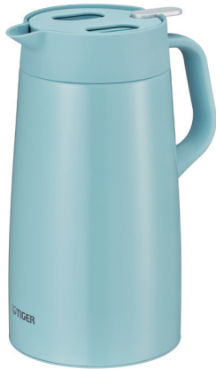
アクアブルー<AC> (PWO-A120・A160のみ)