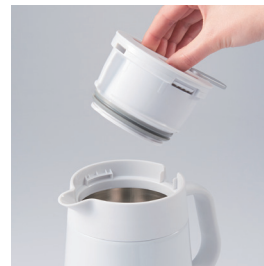
ワンタッチふた着脱

口径は約7.5cmと広口なので大きな氷もそのまま入り、お手入れ時は手を奥の方まで入れて本体の内側をしっかりと洗っていただけます。