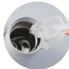
大きな氷も入りやすい 広口約7.5cm