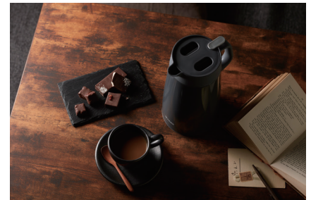
ダークグレー<HD> (PWO-A160・A200のみ)