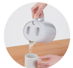
プッシュレバーで 注ぎやすい