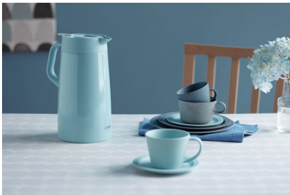
アクアブルー<AC> (PWO-A120・A160のみ)