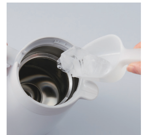
大きな氷も入りやすい