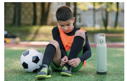
スポーツシーンにぴったり