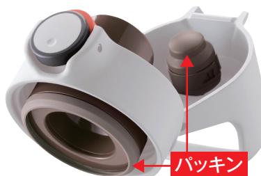
パッキン一体型せん「らくらくキャップ」