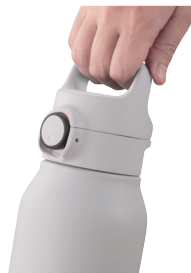
スラントハンドル

傾斜があり握りやすいスラントハンドルつきで持ち運びがしやすく、ふたはワンプッシュで簡単にオープンするので、片手で操作して、すばやく水分補給することができます。