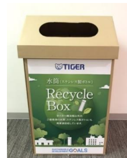
回収ボックスイメージ

※再生ステンレス材を利用した製品はステンレス製ボトルに活用されるのみとは限りません。