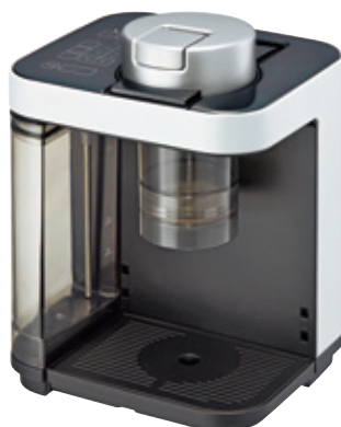
フロストホワイト(WF) ACQ-X020