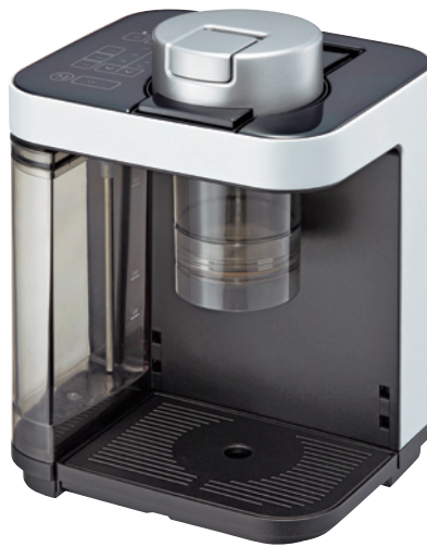
フロストホワイト(WF) ACQ-X020