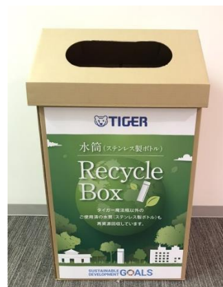
使用済みステンレス製ボトル 回収ボックスイメージ