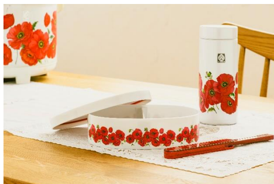
右：ポピー柄のボトル 中央：『タイガー魔法瓶 100th ANNIVERSARY 懐かしの花柄お弁当箱BOOK』（宝島社）特別付録の復刻版 ポピー柄お弁当箱 左：昭和50年発売の電子ジャー〈炊きたて〉JHS型