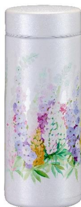
イングリッシュガーデン 〈WE〉