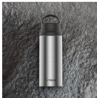
TITANIUM ORE <XZ> (マットシルバー)