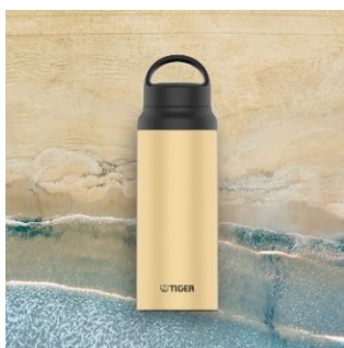
PACIFIC BEACH <CZ> (ライトベージュ)