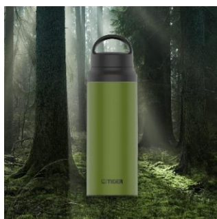
MOSS FOREST <GZ> (モスグリーン)