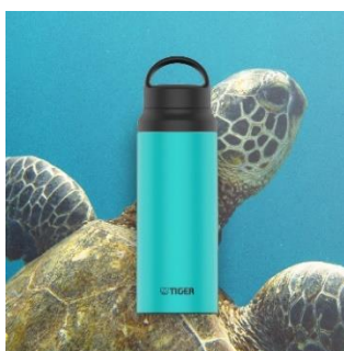
HONU <AC> (コバルトブルー)

サステイナブルを意識した7色のアースカラーと、3種類の容量 (400mL/600mL/800mL) 2種類のせんからご自身のライフスタイルと好みに合わせたカスタマイズを楽しむことができます。