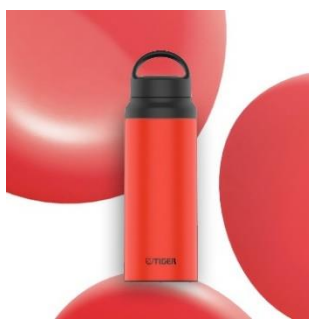
HUMAN ENERGY <RE> (レッド)