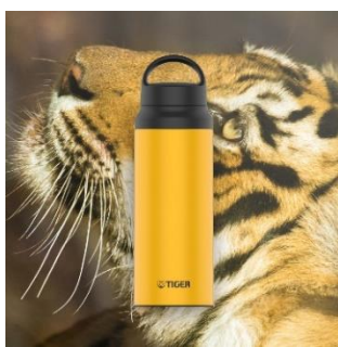
BENGAL TIGER <YE> (イエロー)