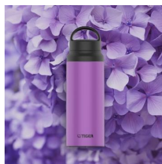
HYDRANGEA <VE> (パープル)