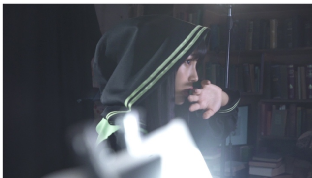
(ドキュメンタリー映像より、ダンスとリップシンクシーンの撮影風景)

現在、今回公開された映像を元に、作詞家・作曲家に楽曲制作を依頼しています。曲の構成も全く決まっておらず、リップシンクで映っている口元に合わせて楽曲制作しなければならないとう、非常に難易度の高いチャレンジとなります。