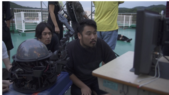
(撮影現場にて、制作スタッフとAI-CD β)

人工能によって導きだされたクリエイティブディレクションの制約の中で、制作を進めなければなりません。そのため、今回は映像監督をはじめ、振付け師、衣装デザイナーなどの制作スタッフが通常制作フローとは異なり、“楽曲の無い”状態で撮影するにあたり、様々な工夫を凝らしました。