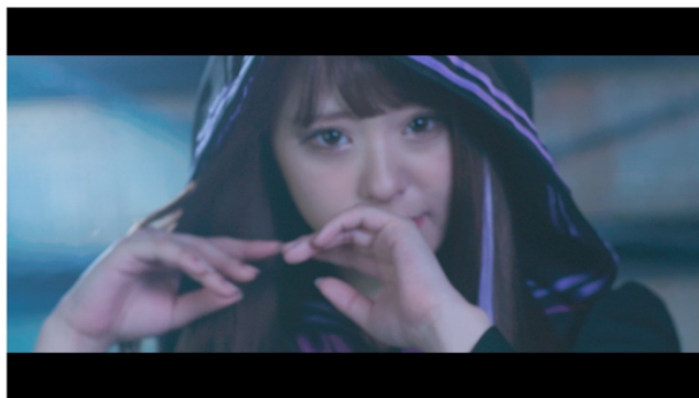
(公開されたミュージックビデオより、ダンスとリップシンクシーン)