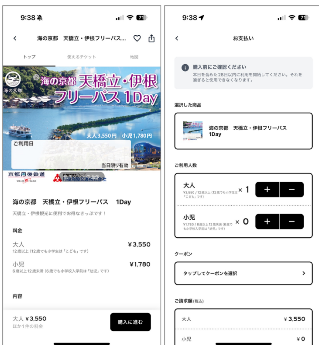
チケット選択画面