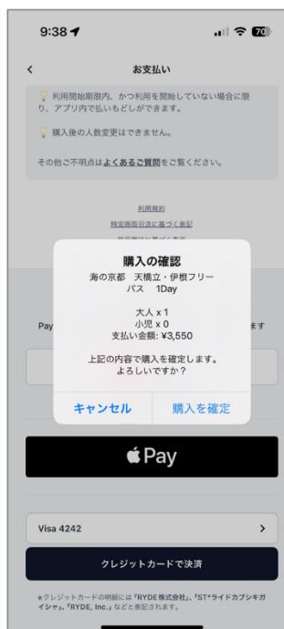
チケット購入画面