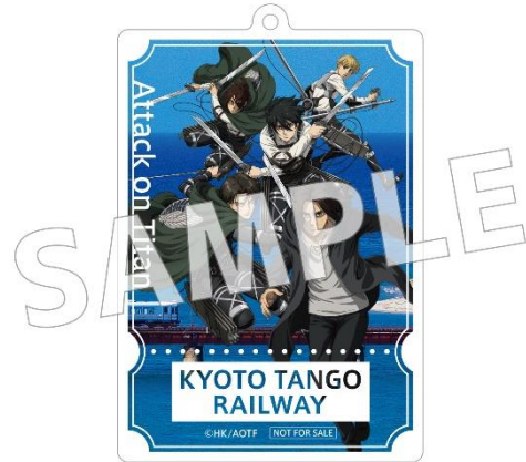
《前期特典イメージ》 (オリジナルアクリルキーホルダー) 本体サイズ約 W60×H90mm

前期の特典はオリジナルアクリルキーホルダー。特典と乗車券面には、美しい海岸線と京都丹後鉄道を背景にエレンやリヴァイたちがクールに描かれます。後期の一乗車券面デザイン、特典については公式サイトにて発表します。ご期待ください！