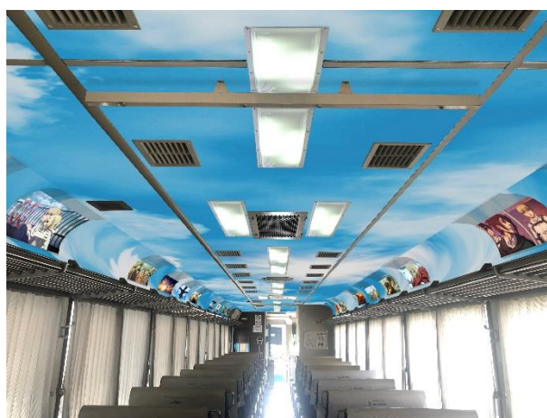
『海の京都を走る“進撃号”』内装