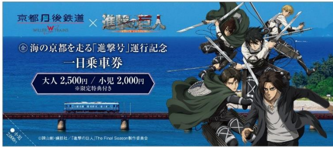
海の京都を走る「進撃号」運行記念 一日乗車券(イメージ)

オリジナル特典付乗車券「海の京都を走る“進撃号”運行記念一日乗車券」を販売します。販売期間は前期と後期に分かれ、それぞれの期間で異なる乗車券のデザインと特典が楽しめます。