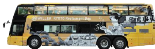
京都レストランバス外観

京都レストランバスの外装は、京都の景観に合わせた和テイストのイラストでデザインしており、内装は本物の石でできた階段や行灯をあしらい、格子や木をふんだんに使うなど、「老舗料亭」のような和の落ち着いた空間になっています。