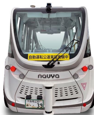
▲事業用の緑ナンバーで運行

・緊急時、車内外のドアリリースレバー手動操作でドア開錠と、緊急脱出ハンマーで窓ガラスを割って脱出可能です。