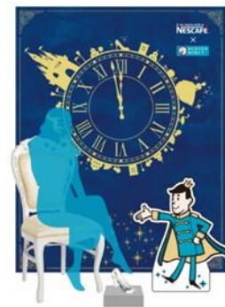
店内のフォトブース(イメージ)