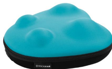
ドクターエア ボディクッション