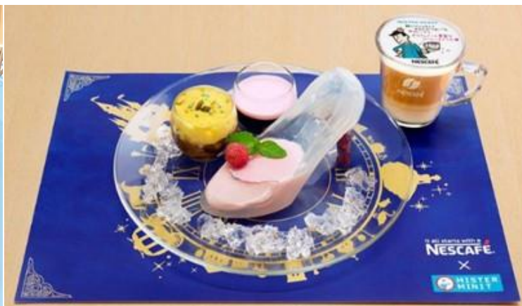
シンデレラスイーツ(イメージ)