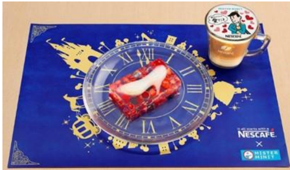
シンデレラ スイーツ・ミニ (イメージ)