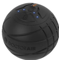
ドクターエア 3Dコンディショニングボール

「ネスカフェ×ミスターミニット シンデレラカフェ」では、3分間に最大約12,000回振動するストレッチサポートツール「ドクターエア 3Dコンディショニングボール」、大小4つの突起と心地良い振動でピンポイントにアプローチするマルチストレッチツール「ドクターエア ボディクッション」で、お身体のケアもしていただけます。