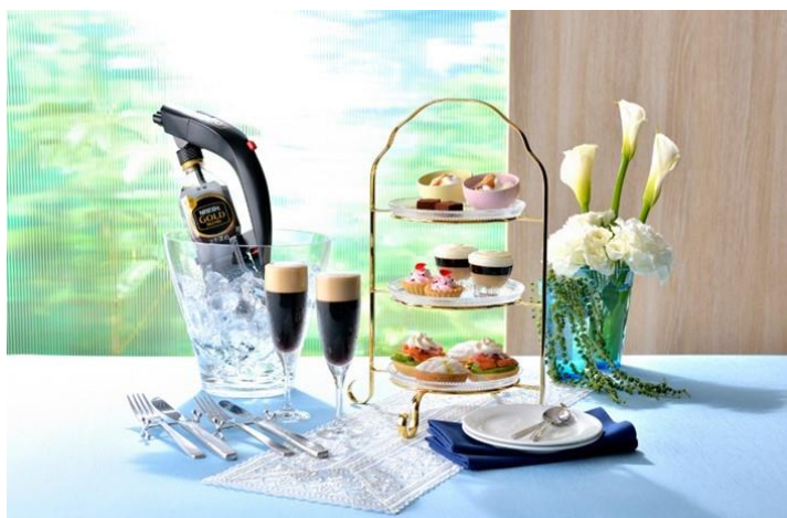
提供メニュー(イメージ)