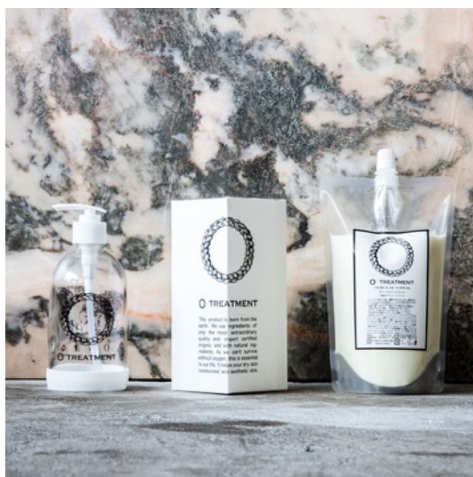
オー・シャンプーガラスボトルセット(税込6,270円) オー・トリートメントガラスボトルセット(税込6,600円)/各商品内容量：詰替用470ml・ガラスボトル365ml

O skin & hairは、地球を守る持続可能な未来への取り組みとして、環境へ配慮した製品開発にも、ブランドスタート時から精力的に取り組んでいます。