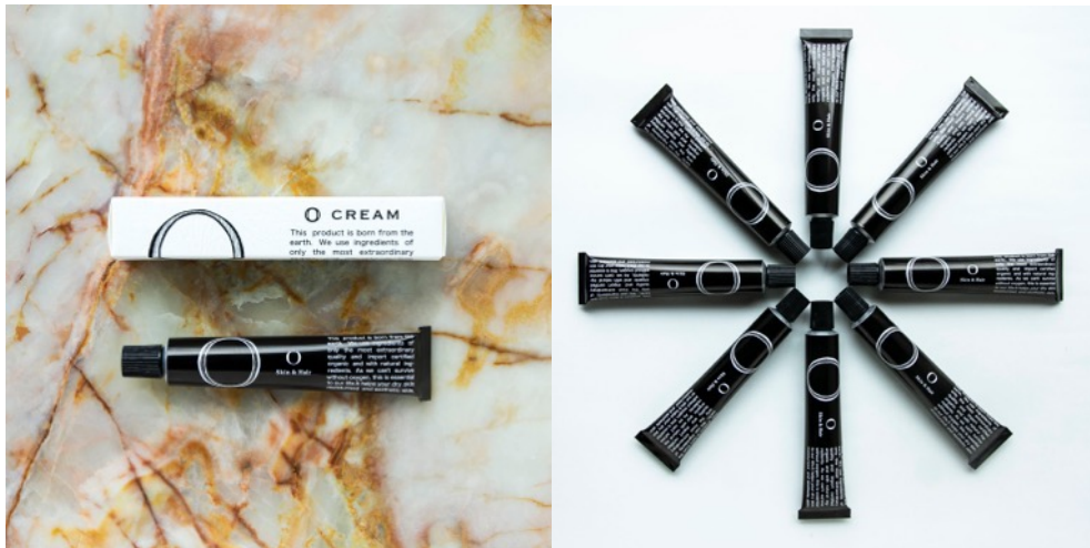
O・CREAM (オークリーム)(内容量50g / 税込2,640円)

トータルケアブランド「O skin & hair (オースキンアンドヘア)」は、百貨店ポップアップストアや、ブランドオフィシャルサイトにて、ハンド・フェイス・ボディ・ヘアクリームとしてまでマルチに使うことのできる、『O・CREAM (オークリーム)』(内容量50g / 税込2,640円)を、9月28日(火)に新発売いたします。