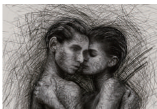
メインビジュアル Design by TATSUKI IKEZAWA