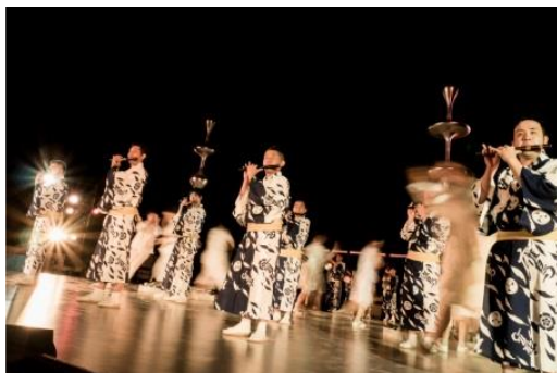
東京キャラバン in 京都(2017年)