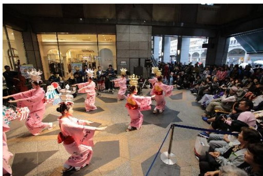
東京キャラバン in 熊本(2017年)