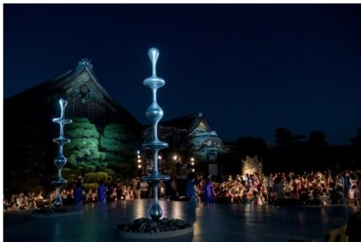
東京キャラバン in 京都(2017年)