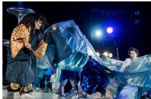
東京キャラバン in 京都(2017年)