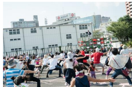
東京キャラバン in 八王子(2017年)