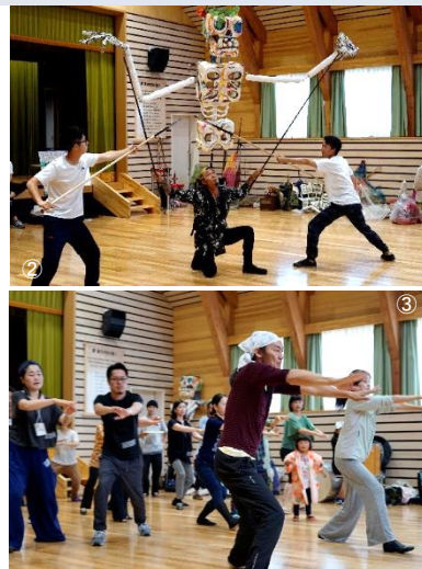
①2017年「東京キャラバンin熊本」②③「東京キャラバンin豊田」創作ワークショップ(②GIANT STEPSと棒の手 ③近藤良平の振付を踊る参加者)