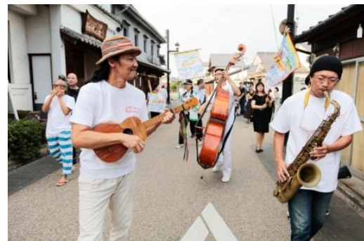
東京キャラバン in 熊本(2017年)