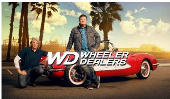
「名車再生！クラシックカー・ディーラーズ」(旧シーズン)

<関連番組画像>