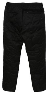
・キルトパンツ 価格：¥30,800 カラー：ブラック サイズ：S～XL