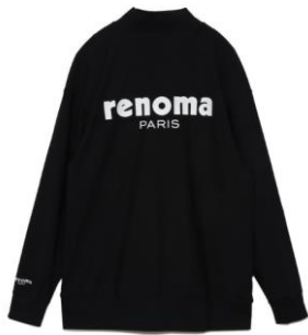
・長袖PORO 価格：¥19,800 カラー：ブラック/ベージュ サイズ：S～XL