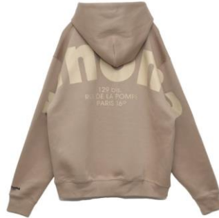
・長袖フーディー 価格：¥27,500 カラー：ブラック/ベージュ サイズ：S～XL