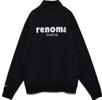
・ハーフジップ 価格：¥27,500 カラー：ブラック/ベージュ サイズ：S～XL