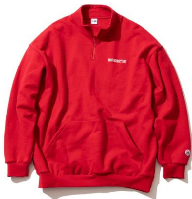
・ハーフジップスウェット 価格：¥17,600 サイズ：M～XXL