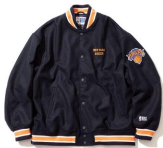
・メルトブルゾン 価格：¥39,600 サイズ：M～XXL

アイテムごとに6つのチームをピックアップした、各6種展開です。 ※価格は全て税込表記です