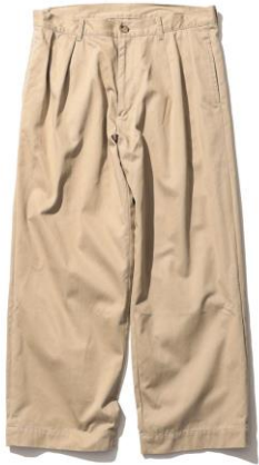
・チノパンツ 価格：¥22,000 サイズ：M~XXL