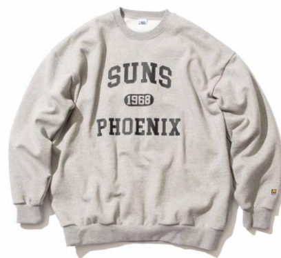
・ベーシックロゴスウェット 価格：¥15,500 サイズ：M～XXL