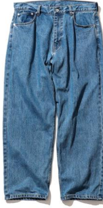
・デニム 価格：¥24,200 サイズ：M~XXL