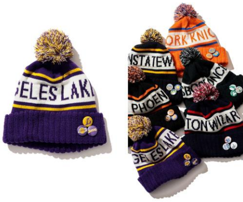
・ニットキャップ 価格：¥6,600 サイズ：フリー