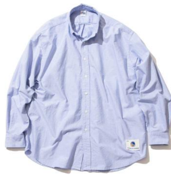
・オックスフォードBDシャツ 価格：¥17,600 サイズ：M~XL