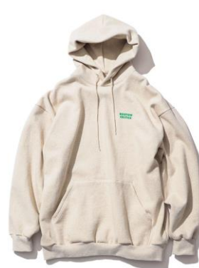
・チームカラーロゴフーディ 価格：¥16,500 サイズ：M～XXL