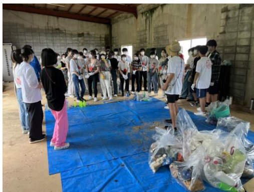
▲10月23日(日)が雨天だったため、屋内にてビーチの砂に含まれるマイクロプラスチックを抽出するワークと事前にビーチで集めた実際の漂着ごみの仕分けにチャレンジするワークを行いました。