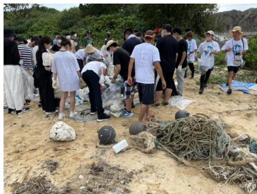
▲10月22日(土)は複数名でチームに分かれてビーチに漂着したごみを回収しました。回収後は仕分け作業も行いましたが、様々な種類のごみが漂着していることに驚きの声があがっていました。