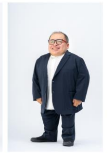
CASE #03 低身長さんの カジュアルセットアップ