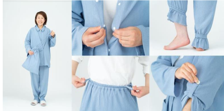
①：入院中も気分が上がる、機能的でオシャレなこだわりパジャマ

特徴：入退院を繰り返す私に寄り添ってくれる、機能的でオシャレなパジャマ。点滴や注射時に便利な袖口ロールアップや、パンツの着脱時に役立つループなどを採用しました。