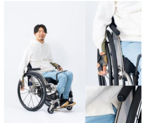
②：車いす生活を考えた工夫が至るところに散りばめられたコットンパーカー

特徴：白い服でもタイヤにこすれて汚れてしまわないよう、内側に肘あてをプラスしました。