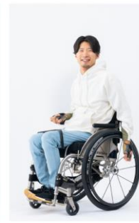
CASE #02 車いすユーザーの こだわりカジュアル