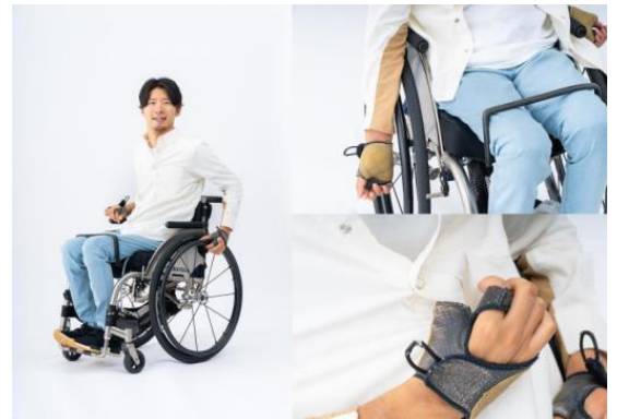
③：見た目も着脱もスムーズなカジュアル細身シャツ