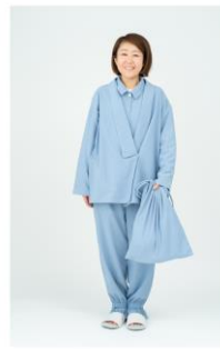
CASE #01 わたしに寄り添う 入院パジャマ