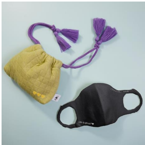
山田 優さんデザイン