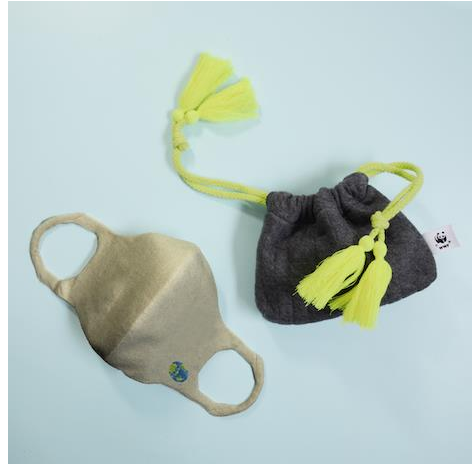
竹下 玲奈さんデザイン