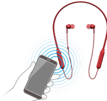
【NFC 機能搭載の Bluetooth®対応機器と簡単接続】

NFC 機能を搭載した Bluetooth®対応のスマートフォンや携帯電話、DAP などを本機にかざすだけで簡単に接続ができるので、保存した楽曲などをワイヤレス再生で手軽に楽しむことができます。