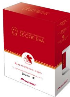
オリジナルパッケージ