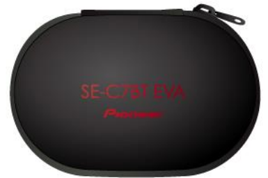
オリジナルイヤホンケース