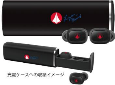
充電ケースへの収納イメージ