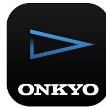
Onkyo HF Player 【無償版】

「Onkyo HF Player(iOS版)」は、ハイレゾ音源を再生できるプレーヤーとして、iOS上でもFLACやDSDなどハイレゾ音源の再生サポート*1*5するアプリケーションとしてご愛顧いただいています。その中で、iCloud Drive ストレージを活用するお客様が増えており、「楽曲の同期や入れ替えにMac/PCではなくiCloud Drive経由で行いたい」、「無償版でもハイレゾ楽曲そのままのクオリティで再生し確認してみたい」などのご要望を多くいただきましたので、ver2.13.0のアップデートにより対応を行います。