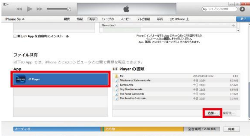
【Finder/iTunes から“HF Player” の「書類」へハイレゾ楽曲ファイルを追加】