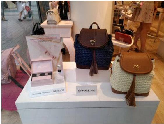
サマンサベガセレブリティ 新宿ミロード店