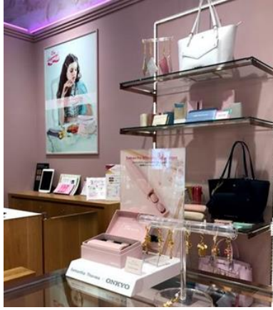
サマンサタバサプチチョイス 錦糸町 PARCO 店