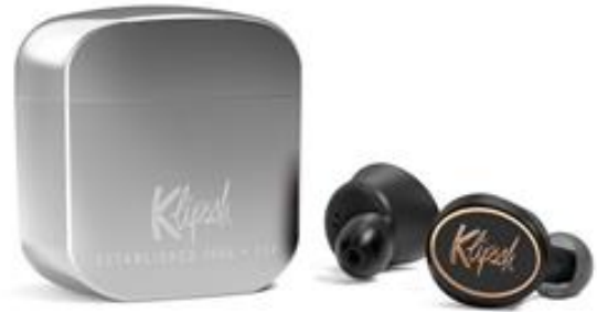
Klipsch ブランドのイヤホン