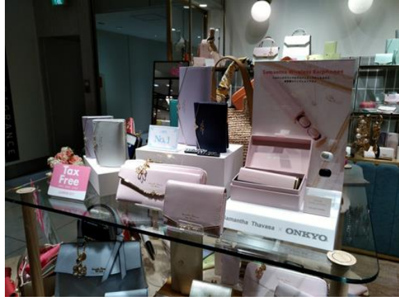
サマンサタバサプチチョイス ルミネエスト店