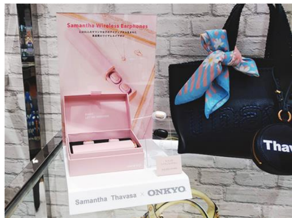
サマンサタバサデラックスサマンサタバサプチチョイス 新宿マルイ本館店