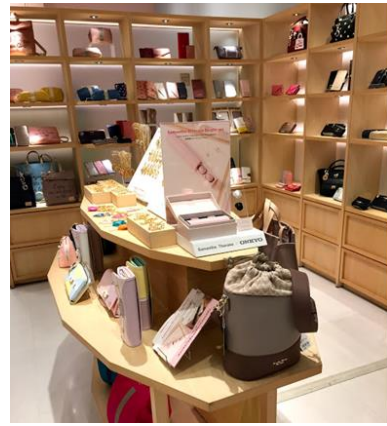
サマンサベガ&サマンサタバサプチチョイス ラゾーナ川崎プラザ店