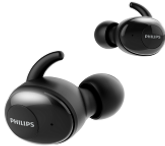
PHILIPS ブランドのイヤホン

8月21日付で、「日本国内での Philips ブランドオーディオ商品の販売代理店権取得のお知らせ」、及び「日本国内での Klipsch ブランド商品販売代理店権取得のお知らせ」を発表させて頂きました。このように、取り扱うブランドや商品を拡充により、売上拡大に貢献してまいります。